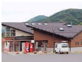
甲子川に面して建つ同駅。清流と山の緑の眺望も魅力だ

釜石の西の玄関口「釜石仙人峠IC」と、国道283号線の交差点に位置する道の駅。特産品や新鮮な野菜などが並ぶ売店と軽食コーナーを備えた交通要所だ。道の駅オリジナルの「釜石ラーメン500円」は、澄みきったスープに細ちぢれ麺がよく絡んで、喉越し抜群の一杯。名物の「醤油ソフト350円」は、釜石定番の味でファン多し。秋には特産品の「甲子柿」が並び、店内が華やかになる。