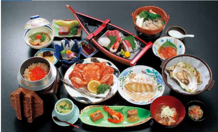
三陸の海の幸を盛り込んだ和食膳の夕食(一例)