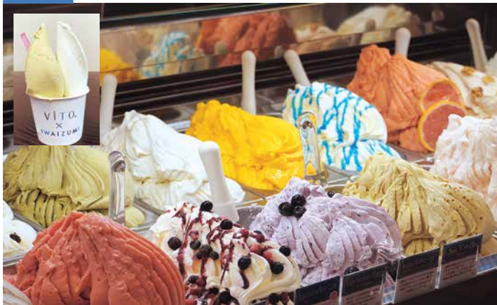
ピスタチオ(プレミアム)とイワイズミルクのカップの組み合わせ