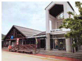
岩泉の恵みたっぷりの道の駅

国道455号沿いの、龍泉洞と三陸海岸の中間に位置する連絡ステーション。中でも注目は、昨年オープンした、東北初出店のイタリアンジェラートカフェ「VITO×IWAIZUMI:ピトクロスイワイズミ」。ケースに並んだ、美しくデコレートされた18種類のジェラートが目を引く。「ダブルカップ」は420円～、「ダブルコーン」は440円～。中でも、岩泉産の新鮮牛乳を使った「イワイズミルク」が人気。