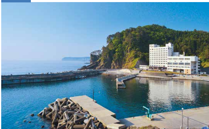
ホテル正面に入り江があり、三陸海岸ならではの風景が広がる