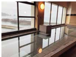
太平洋を望む展望大浴場では、漁り火や昇る朝日に癒される

三陸海岸が目の前、そして緑豊かな丘を背に建つホテル。温かく迎えてくれる開放的で明るいロビーラウンジでは、ゆったりとした至福の時間が過ごせる。大浴場は眼下に雄大な自然美が迫る展望風呂。太平洋から昇る朝日が美しい朝風呂を、ぜひ早起きして体験しよう。その日仕入れた三陸の魚介類を豊富に使った旬を味わう料理や、「北山崎」「鶉の巣断崖」などの観光に便利なアクセス環境も魅力。