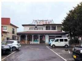
地元で親しまれる老舗食堂

国道45号から少し奥まった場所に店舗があるので、道沿いに建つ緑色の三角屋根の弁当販売所を目印に。アットホームな佇まいは、地元民のみならず遠方からの支持率も高い。魚介類はもちろん三陸で育まれた海の幸を使用しているが、米や肉類も岩手県産という徹底ぶり。人気メニューの「日替わり海鮮丼1,150円」は、その日ごとに厳選された三陸の地魚を9種類盛ったボリュームたっぷりの一品。