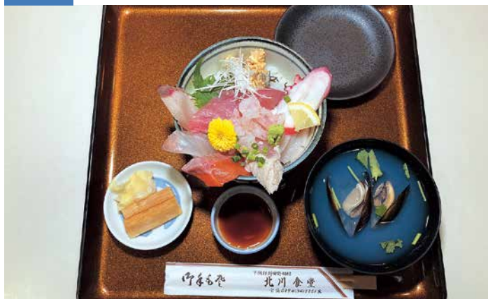
人気の「日替わり海鮮丼」は厳選された魚介類が楽しめる