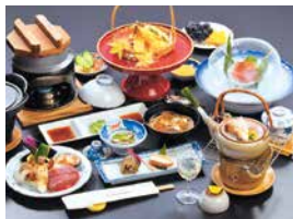
秋期限定「松茸御膳」は地元岩泉産の松茸が味わえる

日本三大鍾乳洞の一つ「龍泉洞」のすぐそばにある、広大な自然に囲まれた宿。清水川のせせらぎが優しく迎えてくれる遊歩道もあり、岩泉の自然を満喫できる。また、地産地消を心掛けているという料理長自慢の料理も味わえる。特に、秋季限定の「松茸御膳」は、全国でも有数の松茸の産地である岩泉の松茸の豊かな香り、歯ごたえ、そして深い味わいの全てを存分に楽しめる評判だ。