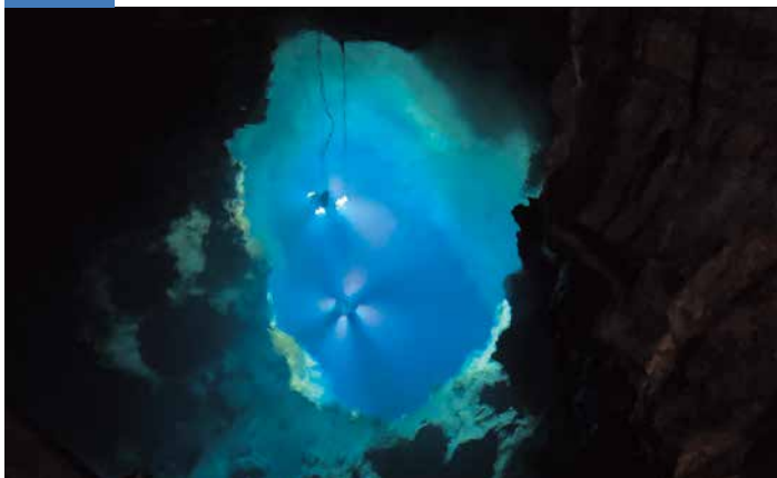
公開されている龍泉洞の中で最も深い「第三地底湖」