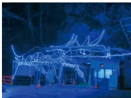
ドラゴンブルーの奇跡の地底湖、龍泉洞の入り口(ライトアップ)

龍泉洞は日本三大鍾乳洞の一つとされ、また洞内に棲むコウモリと共に国の天然記念物に指定。無数の鍾乳石や石筍、地底湖が広がる美しい洞内総延長は、知られている所で4,088mで、そのうち700mを公開中。見つかった地底湖は8つで、そのうち3つを公開中。中でも第三地底湖は水深98m。1967年の潜水調査で発見。現在ここが観光コースの最終地点となっている。