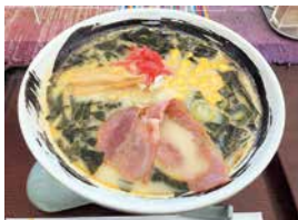
肉厚の田野畑産わかめが嬉しい「わかめたっぷりミルク麺」

柔らかな木の香りの空間が印象的な新しい建物の道の駅。田野畑村は三陸の豊かな漁場で採れる海産物、山菜などの山の食材と、海と山の文化が融和する場所。品揃えが充実した産直はもちろん、食堂では「田野畑産わかめ」と「たのはた牛乳」をふんだんに使った「わかめたっぷりミルク麺850円」が一押し。一面のわかめと、一見豚骨のようにみえるスープは、あっさりした優しい味の余韻をのこす。