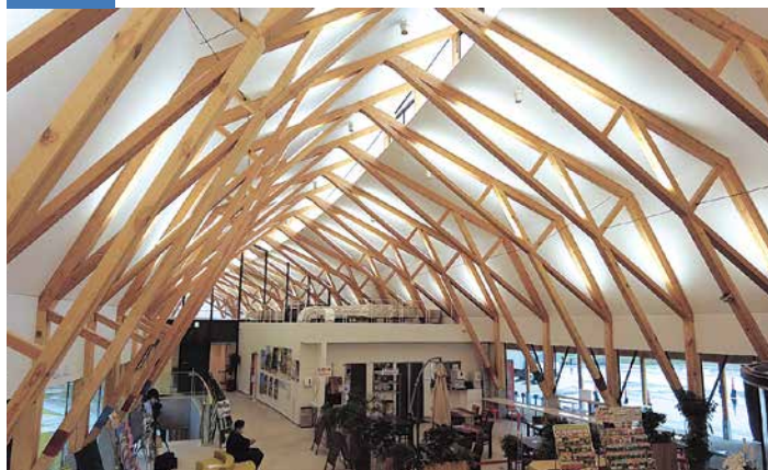
リニューアルした高いドーム型の天井が開放的な「道の駅たのはた」